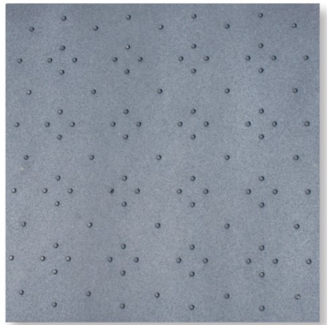
Figuur 1 Bovenaanzicht

Octrooi houder Kick TG Holding: EP 1087061 klanktegel